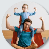
И ещё 5 событий