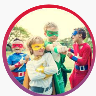
И ещё 11 детей