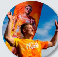
Команда «Бегу за чудом»